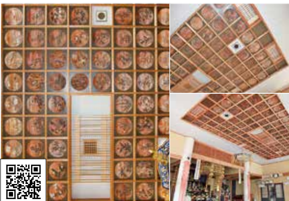
MAP 勝蓮寺 天井画