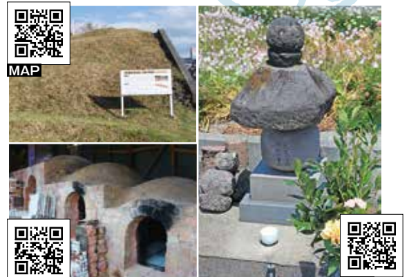
MAP シンニヨム・カンニヨムの墓と庵川焼き窯跡