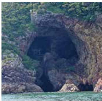
お御蔵さん(遠見半島)

*参考文献 写真で見える宮崎県の地学ガイド（足立富男著）