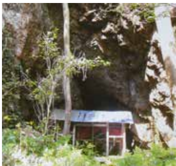
割れ口さん(遠見半島)