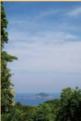
表紙 / 枇榔島 (門川町)

遠見半島から遠望した枇榔島。約1400万年前の火成活動によって生成され、日向岬と同様、島全体が柱状節理からなる。無人島だが、世界一のカムリウムスズメの生息地として知られる。